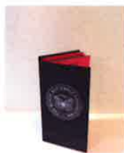
Le nuancier des noirs.

Le nuancier The Black Butterfly Collection est un outil de recherche dédié aux papiers noirs de Fedrigoni.